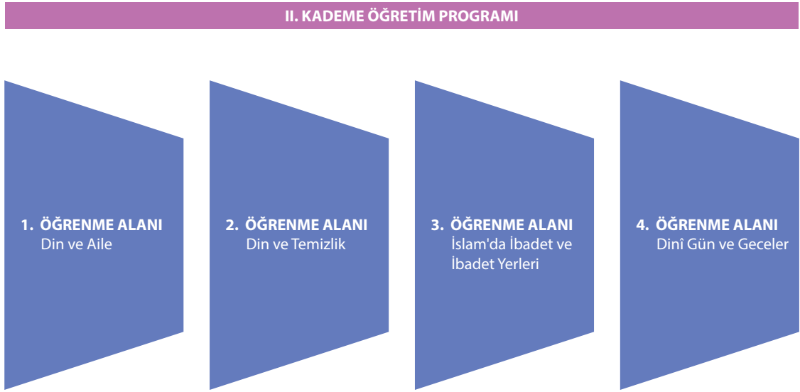
Şekil 2. II. Kademe Din Kültürü ve Ahlak Bilgisi Dersi Öğretim Programı Öğrenme Alanları